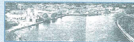
LUCHTFOTO VAN DE VROEGERE SITUATIE AAN HET KANAAL; DE OUDE IJZERGIETERIJ ALLARD IS DUIDELIJK HERKENBAAR.

Met het verhuizen van de ijzergieterij Allard, half de jaren tachtig, naar de industriezone komt een einde aan de havengebonden, sterk vervuulende industriële activiteiten langs het Kanaal.